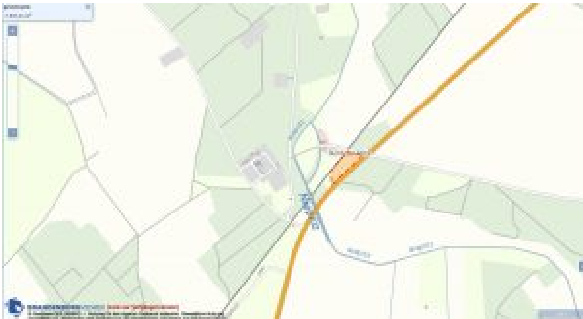
Buchholz B2 an der Mühle

Zur Verfügung gestellt und bearbeitet wurden diese Fläche von Agrar K.G. Wittbrietzen .