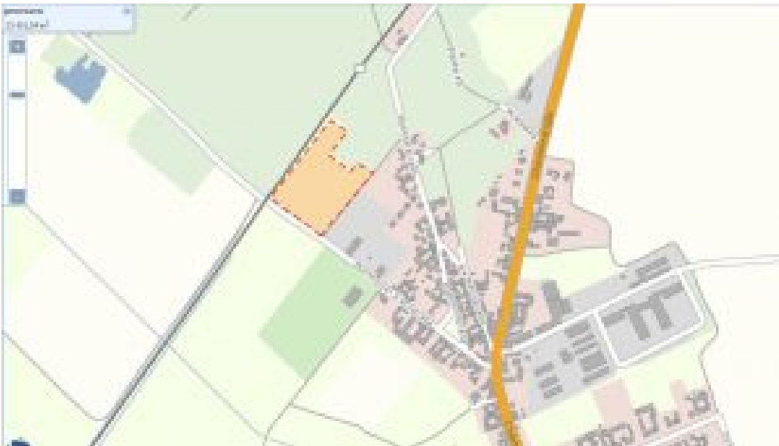
Buchholz Kietzstrasse (Bahnhofsfläche)

Zur Verfügung gestellt und bearbeitet wurden diese 2.4ha vom Spargelhof Klaistow GmbH .