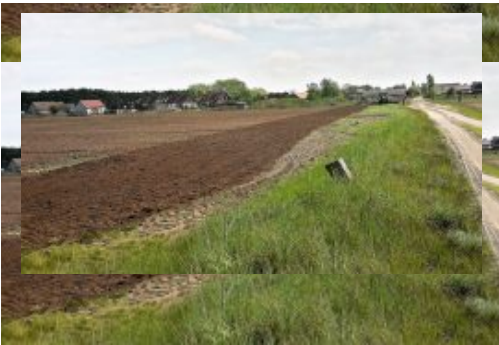
14_20170515_123110- Aussaht -