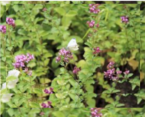
39 - IMG_8787