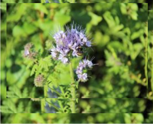
38 - IMG_8785