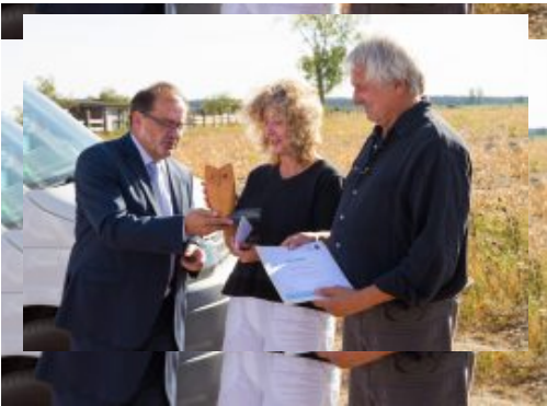
Brandenburger Naturschutzpreis 2018