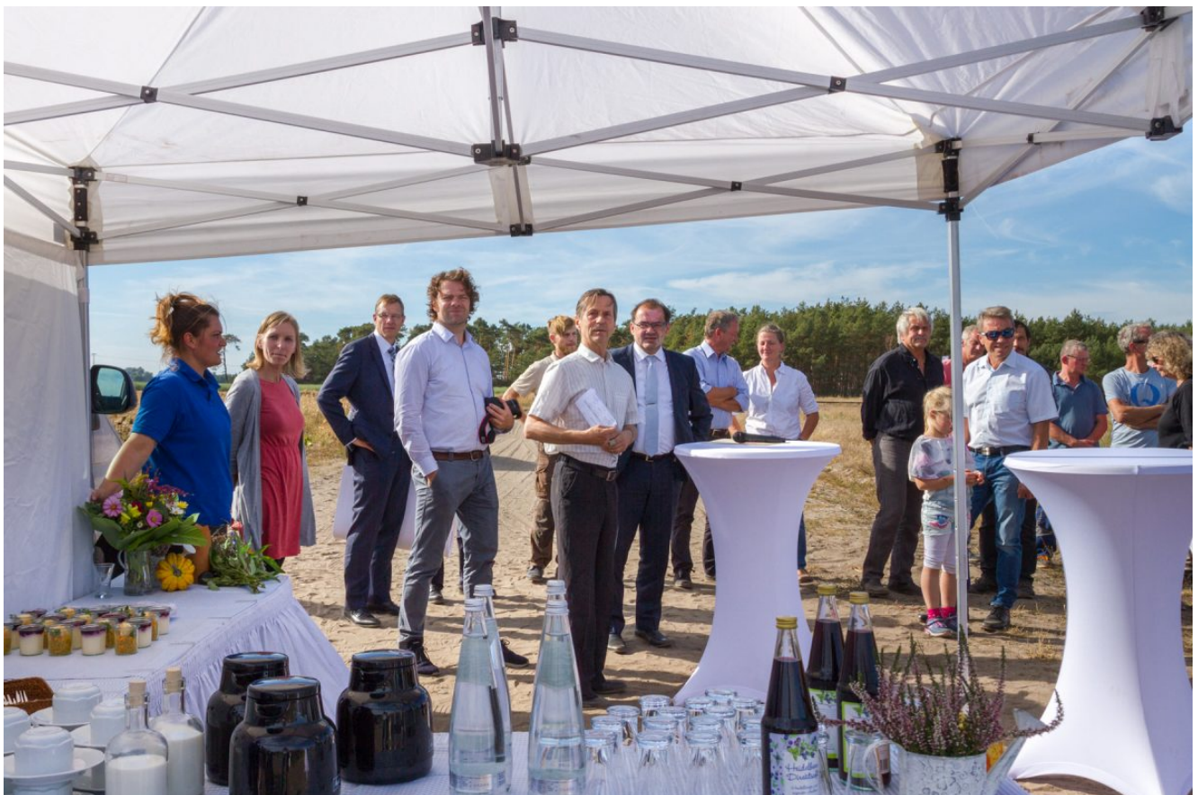
Laudatio durch Dr. Schmidt-Ruhe Naturschutzfonds

Ein kleines Partyzelt, Büfett mit Kuchen und leckeren Häppchen, kalte und warme Getränke, Stehtische mit weißen Hutzen, das Ganze auf einem staubigen Weg neben einem abgeernteten Maisfeld und einem riesigen Insektenhotel mitten in der Agarlandschaft unweit Buchholz bei Beelitz. Etwa 30 Personen haben sich eingefunden, um unserem Verein die Ehre zu erweisen.