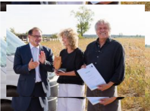
Brandenburger Naturschutzpreis 2018