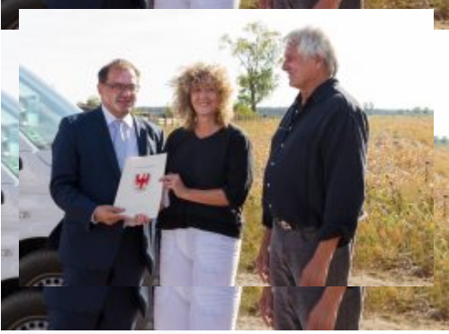
Brandenburger Naturschutzpreis 2018