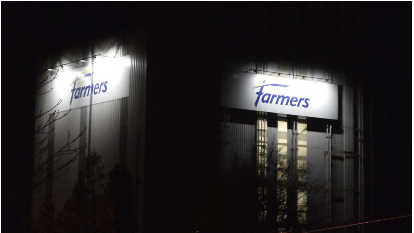
Industriegebäude in Beelitz