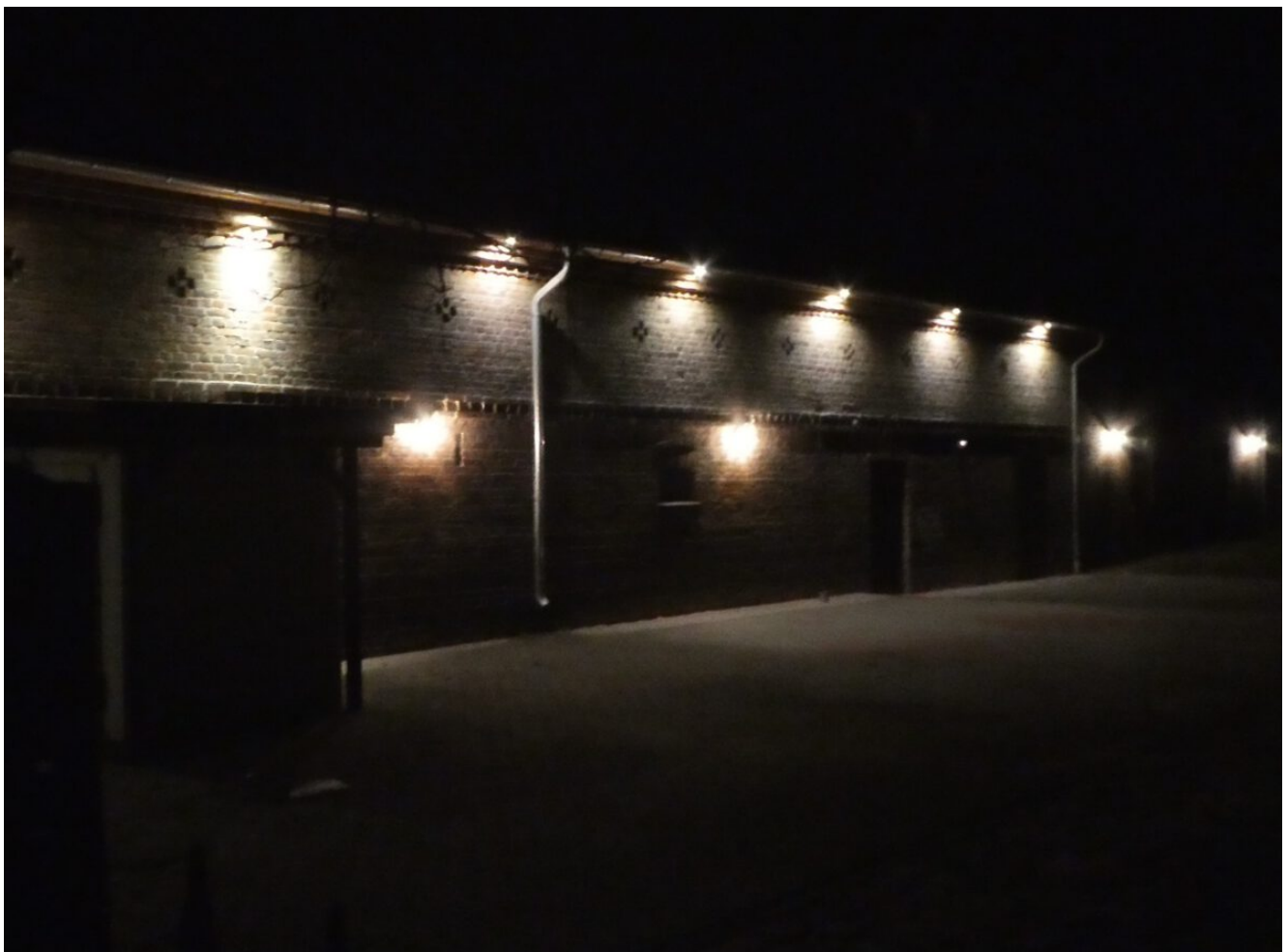
Scheune in Schäpe

Farblich angepasstes Licht! Wenn nun noch von oben nach unten beleuchtet würde, gäbe es deutlich weniger Streulicht in den